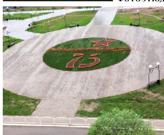
Парк в поселке Воротынский.

Спрашивайте газету «Бабынинский вестник» в магазинах «Елена», «Классный» в поселке Бабынино.